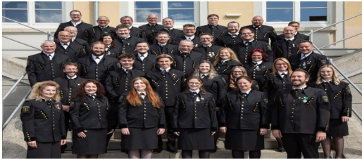
Werkskapelle Böhler Kapfenberg