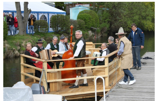
Am Hafen der Marinekameradschaft Prinz Eugen Bruck