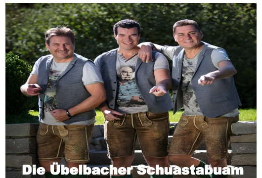
Die Übelbacher Schuastabuam